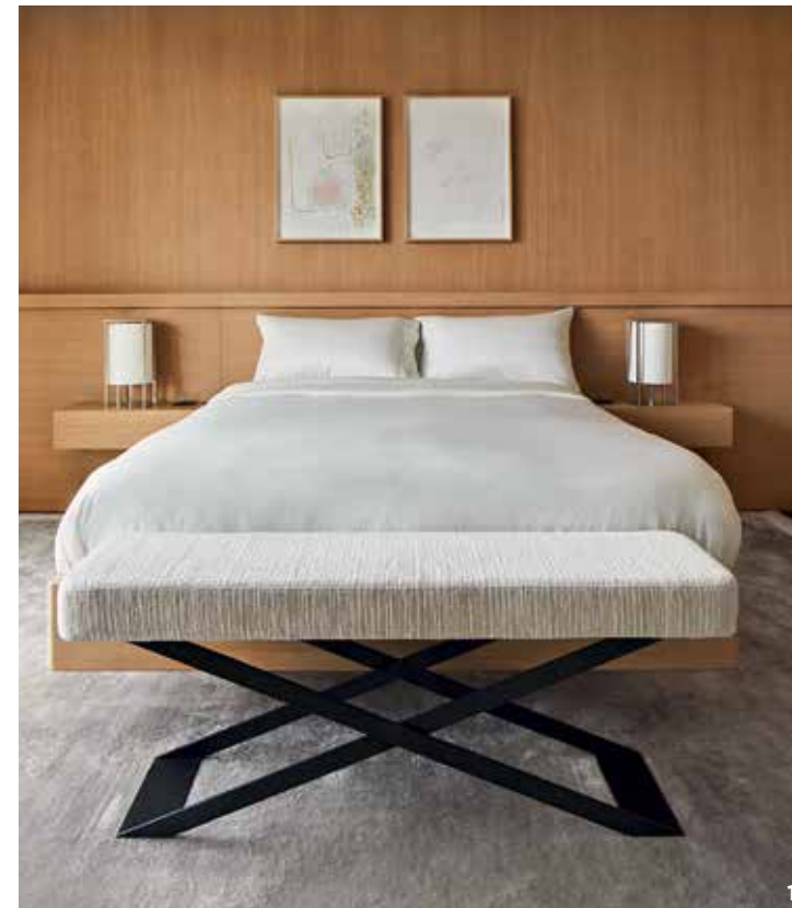
1. Спальни в стиле гостиничных люксов напоминают о том, что заказчик много путешествует. Наполнение спроектировала Небихе Джихан, изготовили итальянские мастера. На стене две работы Вазля Шавки. Лампы Liaigre. Банкетка Nebihe Cihan Studio в ткани de Le Cuona. 2. Столовая. Стол и стулья Liaigre. Каминный портал в травертине Venatino изготовлен на заказ, поры камня заполнены черным гипсом. Бронзовая скульптура Педро Рейеса. 3. Медиакомната. Кресло и столик Liaigre. Кофейный столик Flexform. Арт: Ким Хон Джу, Джойс Пенсато. Бра Apparatus.