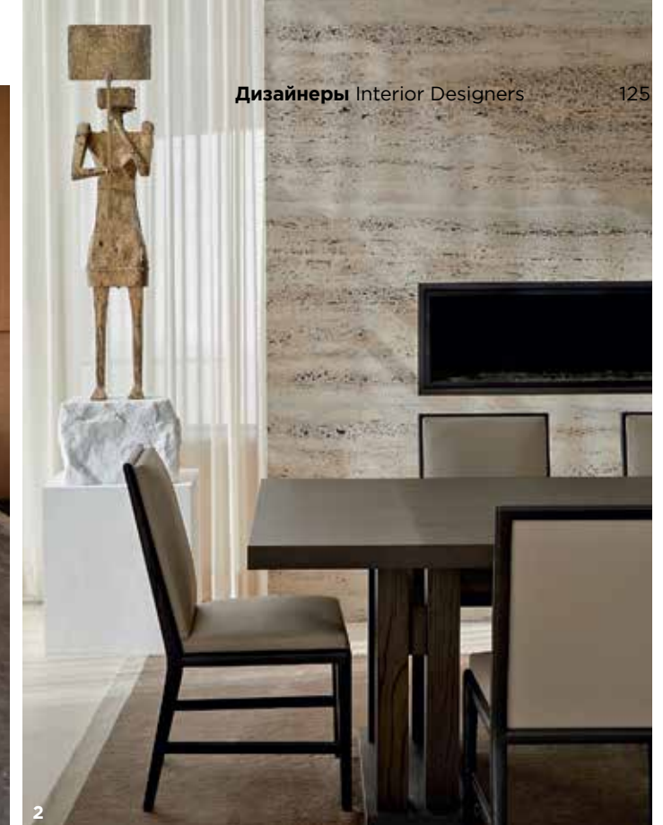
1. The bedrooms were created in the style of hotel suites, inspired by the client's extensive travel. Each bedroom is custom designed by Nebihe Cihan Studio, crafted in Italy. Two artworks by Wael Shawky. Table lamps by Liaigre. Bench by Nebihe Cihan Studio in fabric by de Le Cuona. 2. Dining room. Table and chairs by Liaigre. Bronz Sculpture by Pedro Reyes. Bespoke Travertino Venatino fireplace: the pores of the stone are filled with black stucco. 3. Media room. Armchairs and side table Liaigre. Coffee table by Flexform. Artworks by Kim Hong Joo and Joyce Pensato. Sconces by Apparatus.