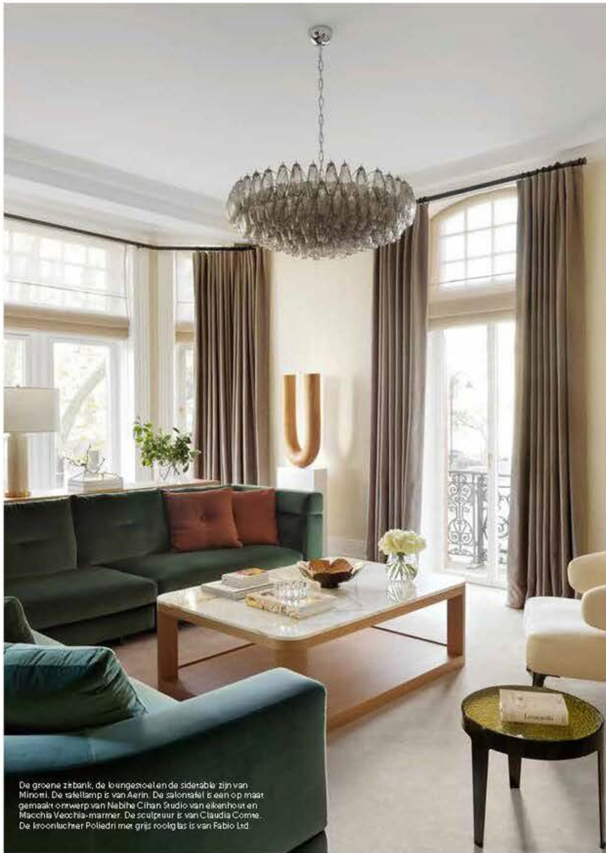
De groene zitbank, de loungestoelen en de salontafel zijn van Minori. De tafellamp is van Aerin. De salontafel is een op maat gemaakt ontwerp van Nebiha Cihan Studio van eikenhout en Macchia Vecchia-marmmer. De sculptuur is van Claudia Corne. De kroonluchter Poliedri met grijs rookglas is van Fabio Ltd.